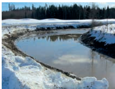
Kuva Pyhän Laurin 10-väylän lampi puhdistettuna.