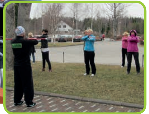
Kuva: Naisten kauden avajaisia vietettiin huhtikuun lopulla klubitalon ravintolassa ja ulkona jumpataten

järjestämässä naisille tapahtumia, jossa parasta on tietysti se, että olen näiden vuosien aikana saanut tutustua moniin ladygolfareihin.”