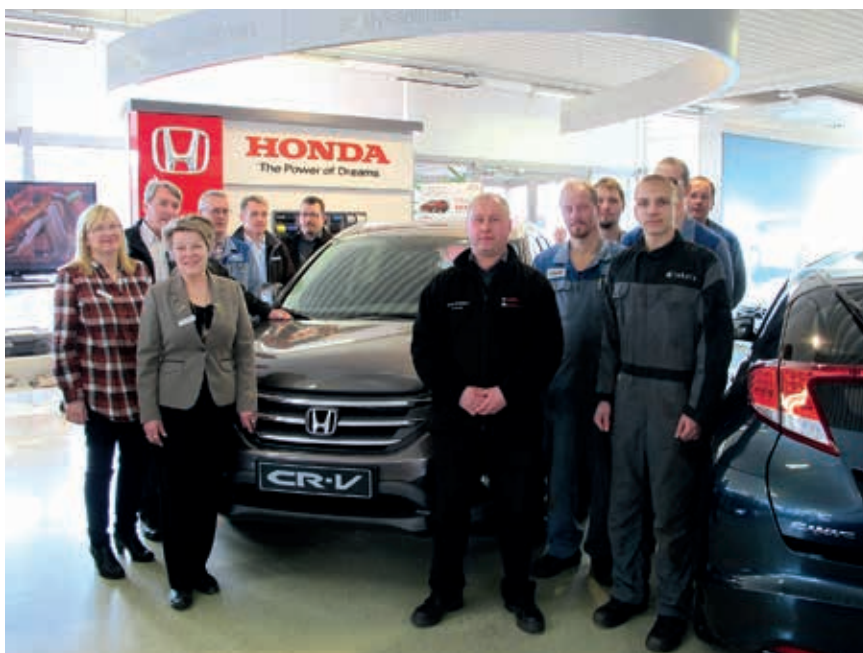
Kuva: Vihdin Autotalon henkilökunta valmiina palvelemaan StLG:n jäseniä.

Golfyhteistyö alkoi oikeastaan Hondan maahantuojan, Honda Motor Europe Finlandin aloitteesta. Honda on toiminut Suomessa viime vuosina aktiivisesti golfin parissa. Erilaisten yksittäisten kenttäyhteistöiden ja kiertueiden lisäksi Hondan maahantuojana on Golfliiton