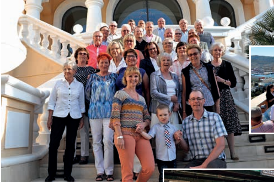
Kuva StLG:n jäsenmatkan iloinen osallistujajoukko..