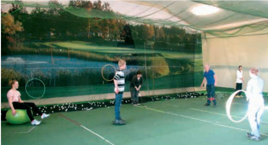
Kuva: Junnut harjoittelivat paljon seuran talvihallissa.

K atson ulos ja näen aurinkoisen maiseman. Lumi on sulanut, mikä tarkoittaa luonnollisesti golffareille sitä, että kausi on aluillaan.