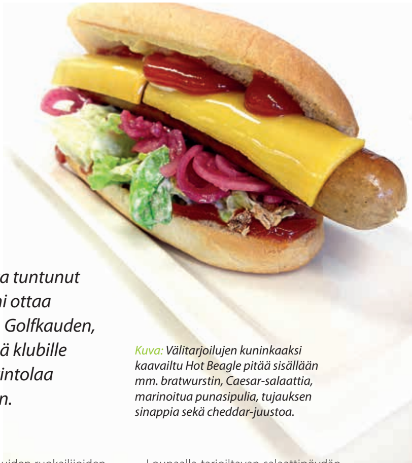
Kuva: Väliharjoitusten kuninkaaksi kaavailtu Hot Beagle pitää sisällään mm. bratwurstin, Caesar-salaattia, marinoitua punasipulia, tujauksen sinappia sekä cheddar-juustoa.

Yhteistyössä St. Laurence Golf Oy:n ja Ry:n edustajien kanssa käytyjen sparrausten pohjalta ovat Väylä 19 ravintoloiden keittiöpäällikkö Esa Mäkinen ja klubiravintolan uusi keittiömestari Mika Hahtiperä lisänneet paitsi tapahtumissa tarjottavia lounasvaihtoehtoja myös laajentaneet päivittäistä lounaslistaa sekä majalla ja ravintolassa tarjottavia tankkausvaihtoehtoja.