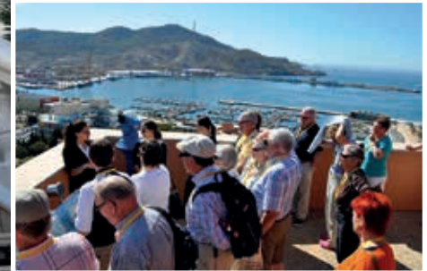
Kuva Klubitoimikunnan matkalla retkeiltiin ja "mopoiltiin".

muut pääsivät tutustumaan vasta loppuviikosta.