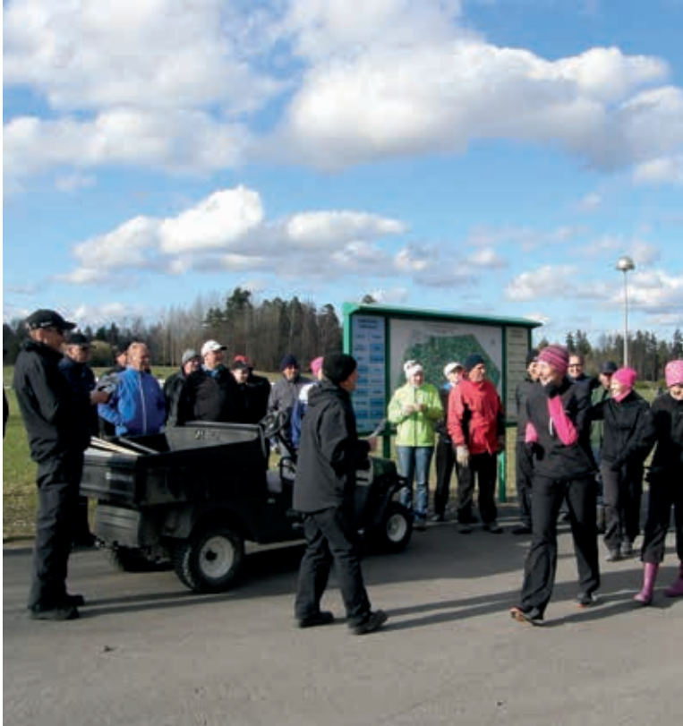
Kuva: Iloista talkooväkeä kerääntyi klubille paljon kylmästä tuulesta huolimatta.