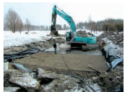
Kuva Suodatuskentän pohjan tekoa