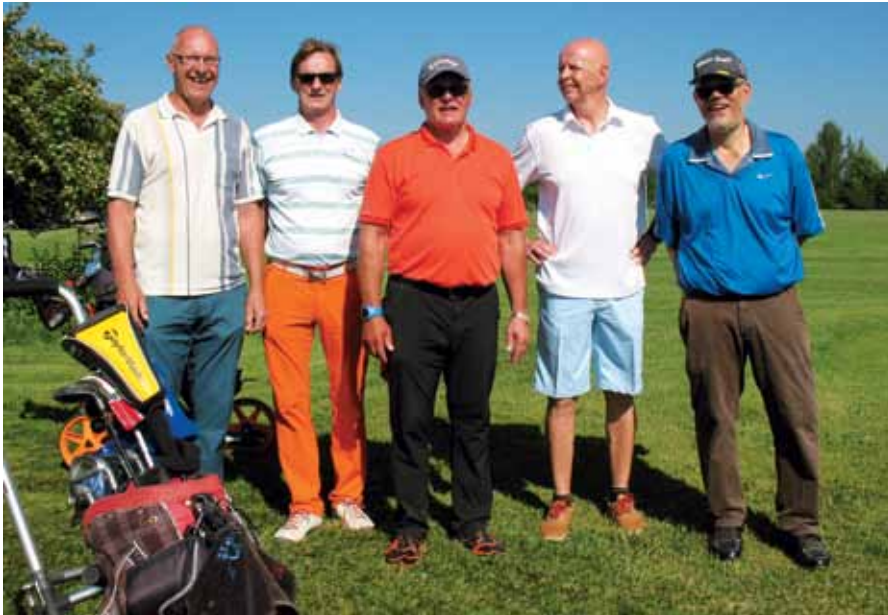
Tunnelmia UAS:n reikäpelistä HieG-Peuramaa.