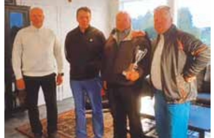
Kapteenin kannun kärkikolmikko ja kapteeni.