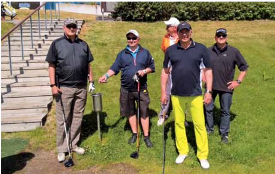
Kultarannan ensimmäisen lähdön lyöntijärjestystä arpomassa.