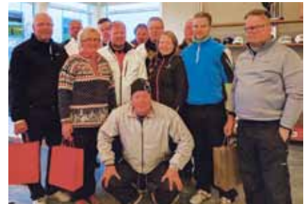
Texas Trio Scramblen voittajat yhteiskuvassa.