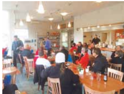
Tunnelmia Cross country pariscramblen palkintojenjaosta.