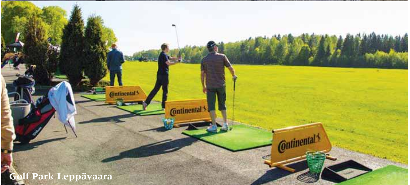
Golf Park Leppävaara