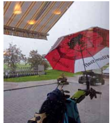
Kostea alku Original Sokos Hotel Vantaa Openille.