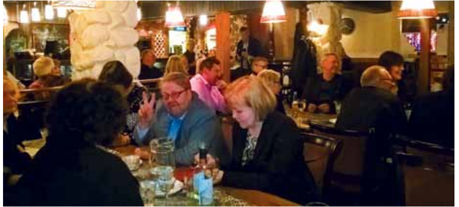
Tunnelmia Hiekkiksen pikkujouluista.

Tällä kertaa juhlassakin pidimme tuntumaa golfiin, kun pikkujouk-