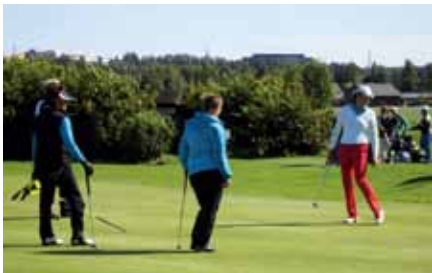
"Tunnelmia seuran mestaruuskilpailuista."