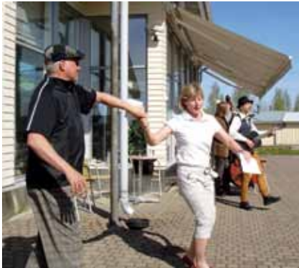
"Rohkeimmat uskaltautuivat laittamaan jalalla koreasti Vantaa-päivänä."