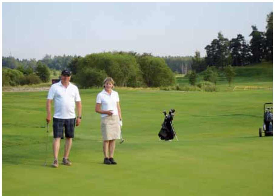
"Upouusi Kehä6 avattiin juhlallisesti 24.7."