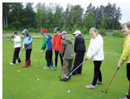
"Junnut keskittyvät puttiharjoitteluun."