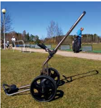
"Uudet golfkärryt saapuivat vihdoinkin ilahduttamaan pelaajia.

Tänä vuonna tavoitteenamme on ollut toteuttaa kentällämme uudistuksia, jotka tekisivät Hiekkaharjasta pelaajia entistä paremmin palvelevan kentän. Isoin muutos entiseen verrattuna on luonnollisesti ollut uuden Kehä6-kentän käyttöönotto heinäkuun lopussa. Kaksi uutta ja upeaa väylää korvasivat kuuden reiän kentällä kaksi vanhaa ja lyhyttä väylää, minkä ansiosta uusi kenttä on entistä miellyttävämpi ja haastavampi pelata. Uudistuneen ilmeen myötä kuuden reiän kenttä on nyt varteenotettava vaihtoehto Pitkälle ysille: Aina ei jaksata tai ehdi pelata yhdeksää reikää tai täyttää kahdeksantoista reiän kierrosta, jolloin voi käydä pyörähtämässä nopeasti kuuden reiän kierroksella. Muutosten jälkeenkin Kehä6 on edelleen oiva paikka myös aloittelijoille tutustua uuteen lajiin. Monet seuran jäsenet ovatkin tuoneet ystäviään kokeilemaan Kehä6:lle, olisiko golf heille sopiva harrastus. Tutustumiskier-