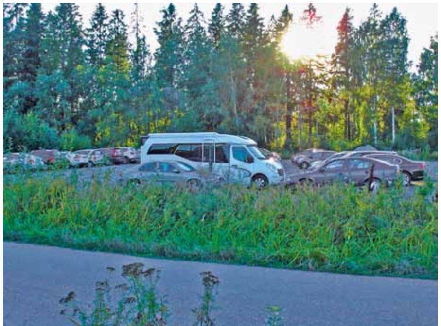
Jätetään parkkipaikoille ajoväylät.